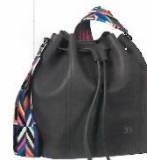
Tom Falter Design

Kleine Crossbody-Formate sind die neuen Stars im Herbst. Sie sind so richtig schön. Hier setzt der Linkauf vornehmlich auf tiefe Edelsteinfarben.